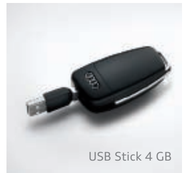
USB Stick 4 GB