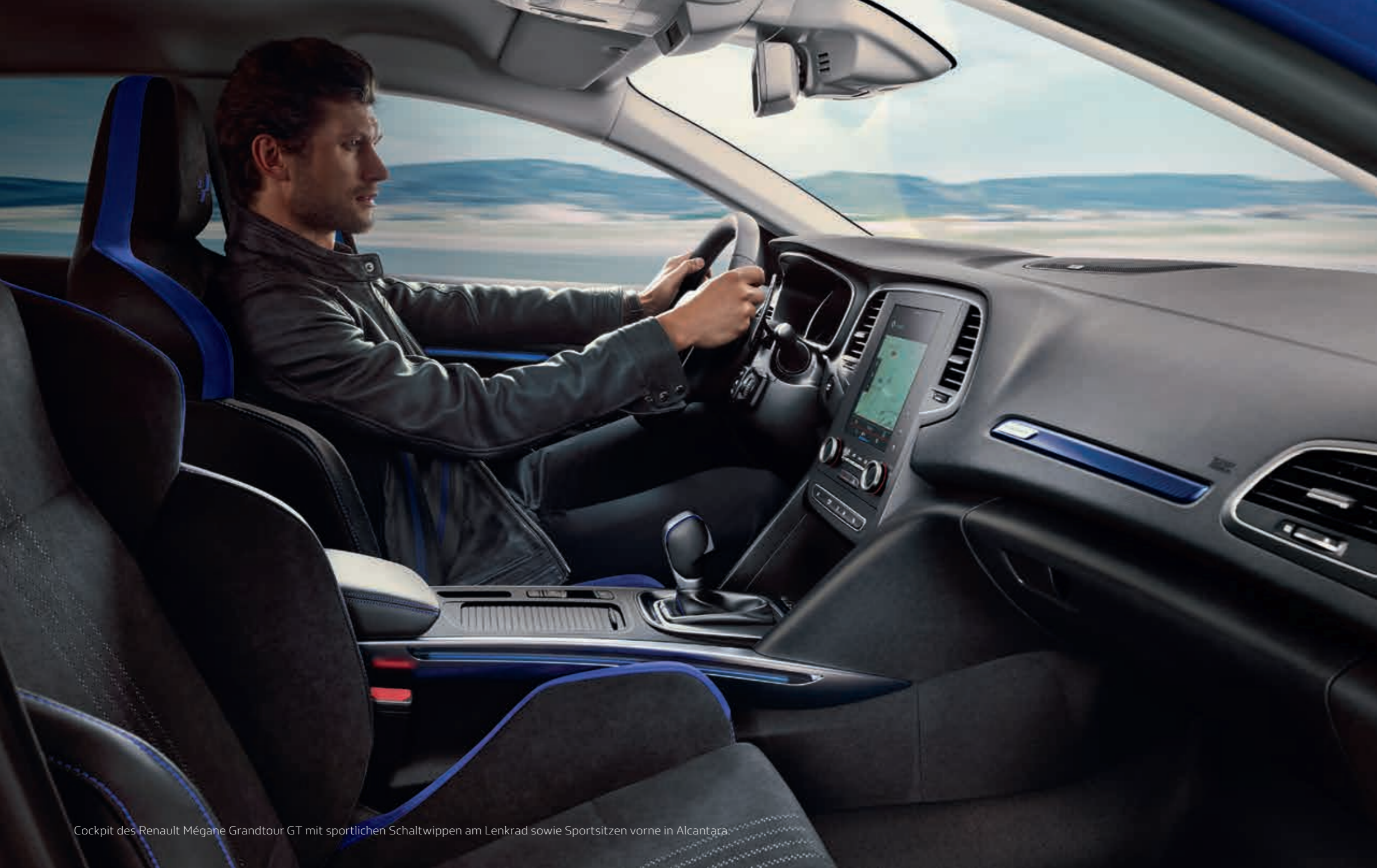
Cockpit des Renault Mégane Grandtour GT mit sportlichen Schaltwippen am Lenkrad sowie Sportsitzen vorne in Alcantara.